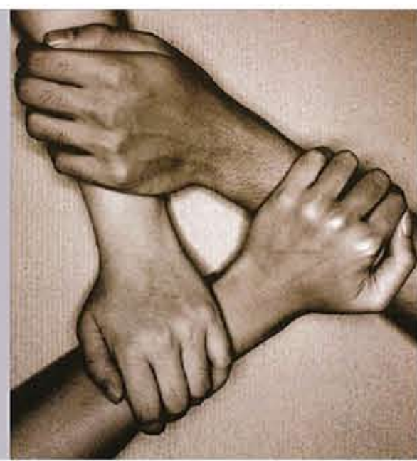
版面內容由「與愛同行」提供