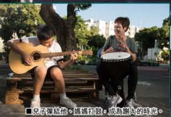
■兒子彈給他、媽媽打鼓，成為謝太太的時光。