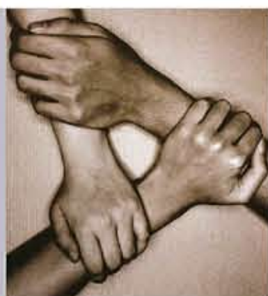
版面內容由「與愛同行」提供