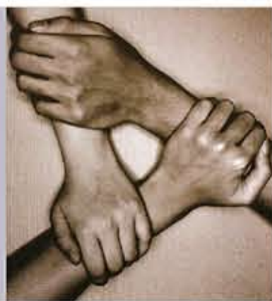
版面內容由「與愛同行」提供