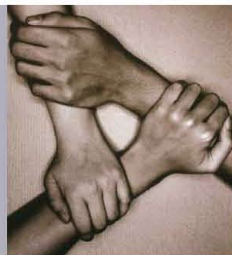
版面內容由「與愛同行」提供