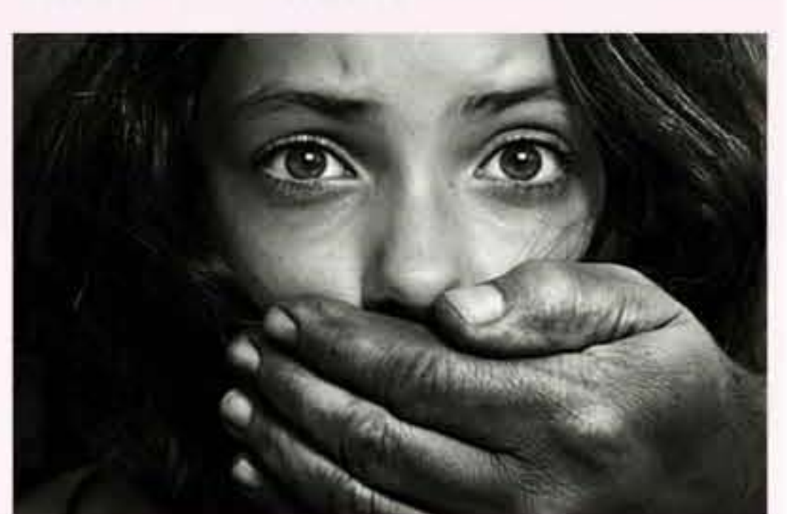
●世界上其中一項最嚴重的罪惡—販運人口,就是人口販賣。

中國雲南的邊境,正是當今其中一個人口販子的集散地。從越南、緬甸、柬埔寨及寮國等地區,都有自願或非自願的人口販運受害者。所謂「自願的受害者」,往往是被人誘騙而來的,一些年輕的少女聽到別人游說,到了中國城市可以每月賺上數百萬元越南盾(約數千元人民幣)。人口販子給她們過關入中國,然後把她們帶到一些髮廊,向人們提供性服務。她們往往被游說可以先試做幾個月,不喜歡的話可以回去。但習慣了「躺著賺錢」的生活,便很難回頭。有一些則再被賣到落後農村或其他國家做新娘。